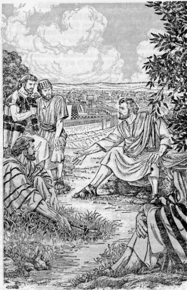
Jesús dijo a sus discípulos lo que sería prueba visible de su presencia invisible en poder real

7. (a) ¿Hay algún acontecimiento aislado que, por sí mismo, sería prueba del acercamiento del “fin”? (b) ¿Cómo sabemos cuándo se acerca el verano? Entonces, ¿cómo podemos saber cuándo ha comenzado a regir el Reino?