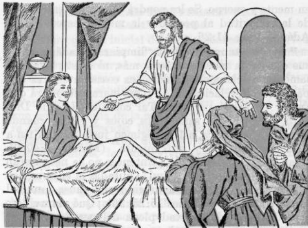
Jesús hasta levantó de la muerte a algunos

15 Podemos tener confianza completa en que esto será una realidad. Recuerde que, mientras estuvo en la Tierra, Jesús no solo curó a los enfermos y lisiados; también hizo volver a la vida a personas muertas. (Mateo 11:2-6) Esto demostró el maravilloso poder que tiene Dios para resucitar a los muertos, un poder que ha otorgado a Jesucristo. Quizás usted recuerde la ocasión en que Jesús llegó a la casa de un hombre cuya hija de doce años de edad había muerto. Dirigiéndose a la muchacha muerta, Jesús dijo: "Jovencita, te digo: ¡Levántate!" ¿Cuál fue el resultado? La Biblia nos dice: "Al instante la jovencita se levantó y echó a andar." ¿Cómo respondieron los padres de la jovencita y otros observadores a este milagro? "En seguida estuvieron fuera de sí con gran éxtasis." Difícilmente podían contener su felicidad.—Marcos 5: 35, 38-42; vea también Juan 11:38-44; Lucas 7:11-16.