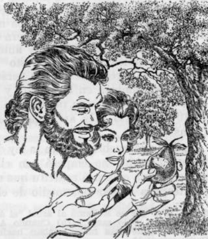
Adán violó deliberadamente la ley clara dada por Dios

8. (a) Por el acto de desafuero de ellos, ¿de qué fueron culpables Adán y Eva? (b) ¿Por qué no debemos juzgar lo grave de lo que Adán y Eva hicieron por la manera en que la gente considera la desobediencia y el robar hoy?