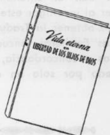
Vida eterna, en libertad de los Hijos de Dios

Estas ayudas prácticas para el estudio de la Biblia le serán útiles para pasar adelante a la madurez, al traerle, entre otras cosas: