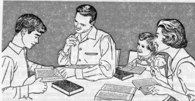
Sesiones regulares de estudio bíblico deben ser parte del modo de vivir de toda familia

15. (a) ¿Qué se les debe enseñar a los niños en lo que respecta a: Mentiras? ¿Robo? ¿Inmoralidad sexual? (b) ¿Cómo pueden los padres entrenar a sus hijos de modo que hagan lo que es correcto aun cuando no estén con sus padres?