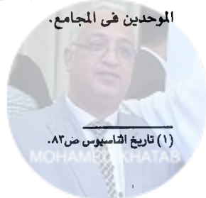
(١) تاريخ اثناثاسيوس ص ٨٢.

الثاني: أن هؤلاء كانوا يعترفون بأن الله جوهر ولذلك أنكروا مساواة الابن لأبيه في الجوهر، ومع أننا سنناقش هذه القضية فيما بعد إلا أننا ننبه أن هؤلاء الموحدين لم يطلقوا على الله هذا الاسم في يوم ما؛ لأن المسيح - ﷺ - لم يقل إن الله جوهر، وهم على درب المسيح يسيرون، وحسبنا أن الكاتب نفسه ممن يؤمن بفكرة الجوهر التي تطلق على الله تعالى. ونكتفي هنا بتتبع خطوات الموحدين في المجمع.